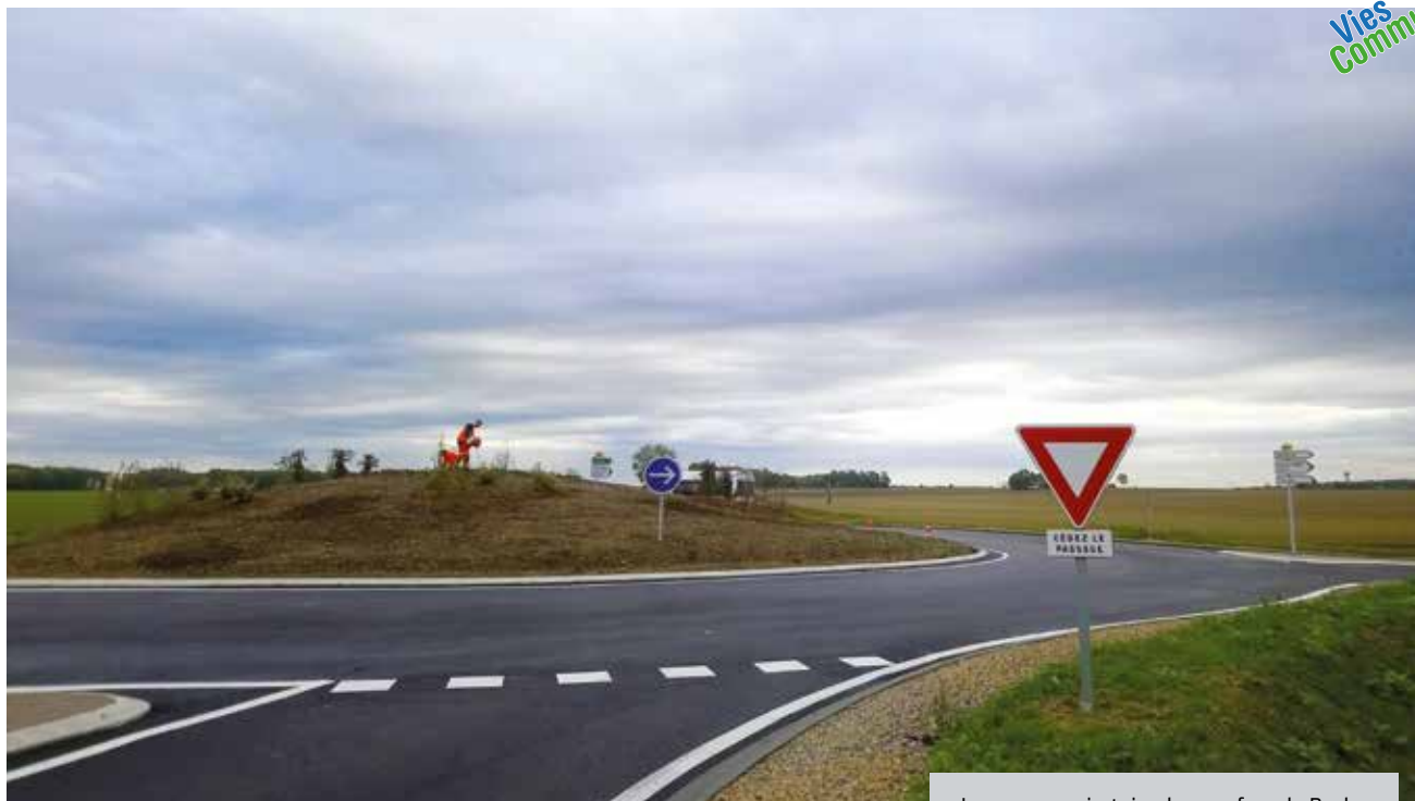
Le nouveau giratoire du carrefour de Puche