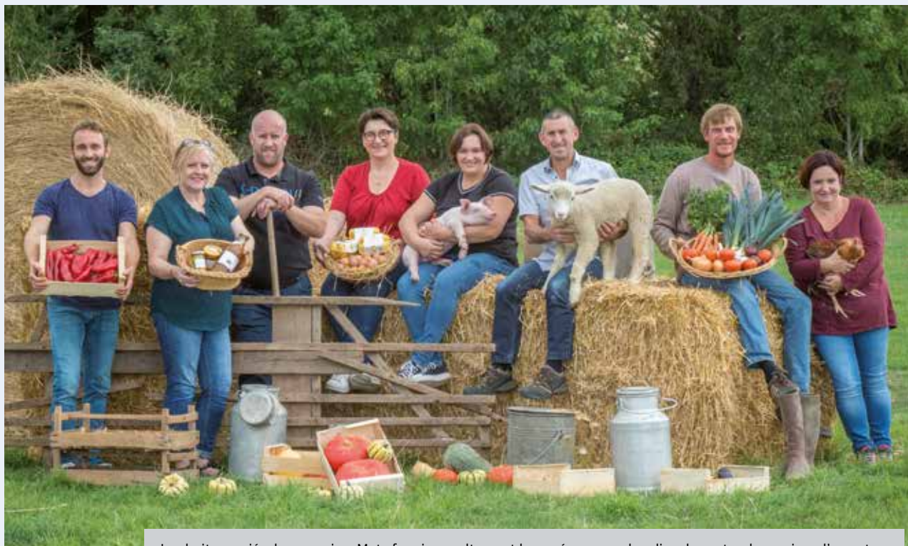
Les huit associés du magasin « Mets fermiers » alternent leur présence sur leur lieu de vente, chaque jour d'ouverture.