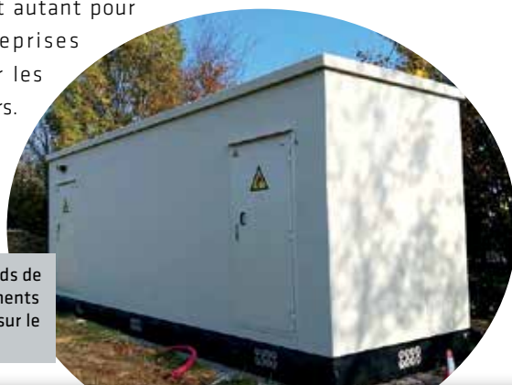
Trois nœuds de raccordements optiques sur le territoire

A la fin de l'année, la CCHCPP sera la première communauté de communes du Grand Est à être entièrement raccordée à la fibre. Un indéniable atout pour ce territoire dynamique et attractif autant pour les entreprises que pour les particuliers.