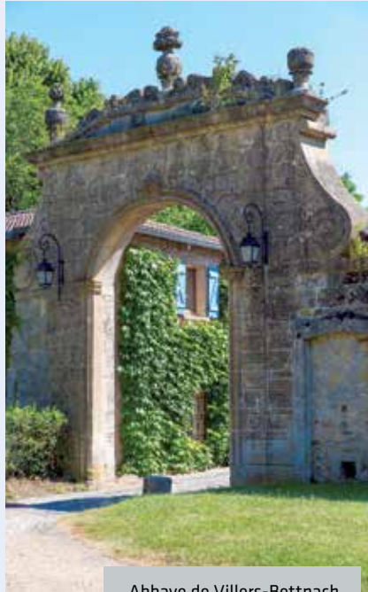
Abbaye de Villers-Bettlach

Pour que cette marche soit un moment de plaisir pour tous les participants, les inscriptions sont volontairement limitées à 400 marcheurs. Les personnes intéressées doivent s'inscrire dès la réception des bulletins d'inscription.