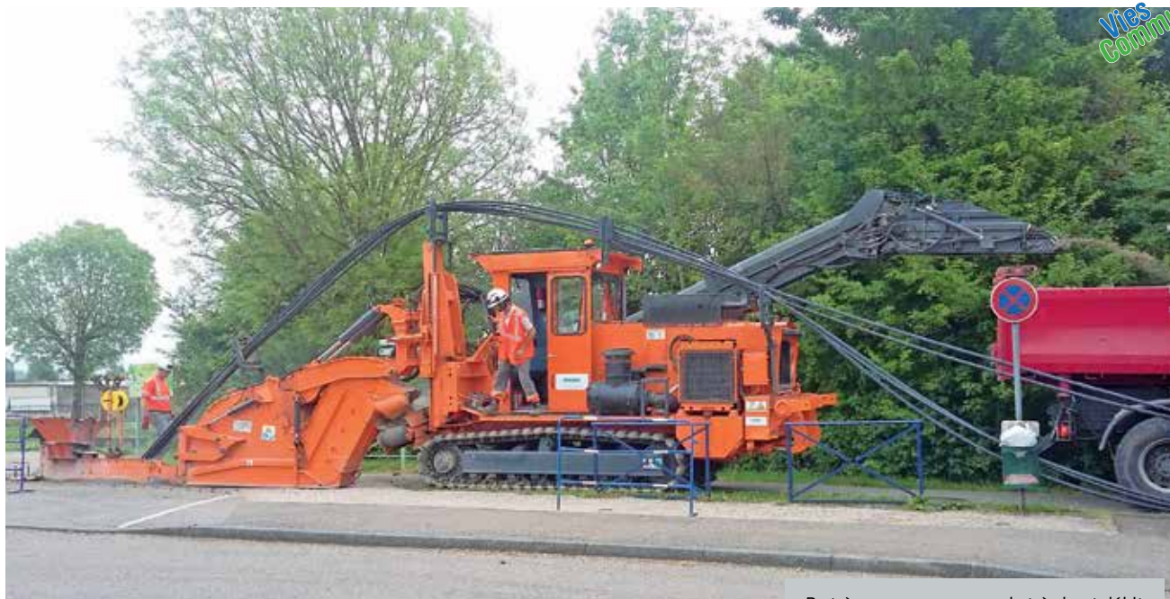
De très gros moyens pour le très haut débit