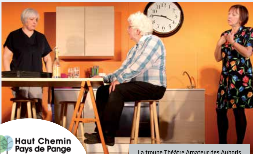
La troupe Théâtre Amateur des Auboris

tournée caritative sur le territoire du Haut Chemin – Pays de Pange. Comme chaque année, les habitants des différentes communes leur réserveront le meilleur accueil possible. En Lorraine, l'association a reversé plus d'un million d'euros à la Ligue contre le Cancer en 2017.